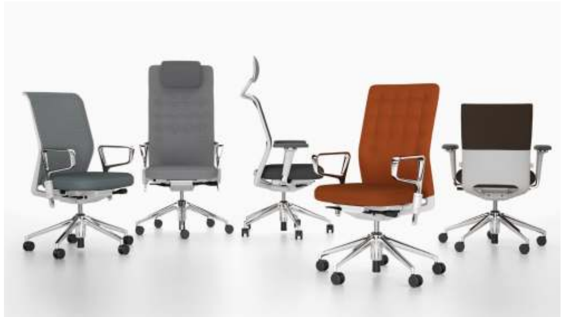
Ausgehend von den vier Grundmodellen kann der passende ID Chair je nach Bedürfnissen und Vorlieben konfiguriert werden

Antonio Citterio und Vitra haben ihre mehr als 25 Jahre Erfahrung aus der Entwicklung von Bürostühlen in der neuen Bürodrehstuhlfamilie ID Chair Concept konzentriert. Der ID Chair bringt eine zurückhaltend elegante Gestaltung und helle Farben ins Büro – und bietet dabei unzählige Möglichkeiten, um Funktion, Komfort und Ästhetik an individuelle Bedürfnisse anzupassen. Dennoch haben alle Varianten eine gemeinsame technische und visuelle Basis. Das beeinflusst die Gesamtästhetik einer Umgebung ebenso positiv wie den Unterhalt und den Service. Mit ID Chair Concept können Unternehmen und ihre einzelnen Mitarbeiter den Stuhl definieren, der zu ihrer Identität passt.