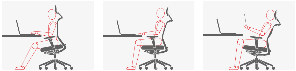
Das Institut für Biomechanik der ETH Zürich – eine der weltweit führenden Hochschulen – hat mit MRI- und EMG-Messungen nachgewiesen, dass die Nutzung der synchronen Vorwärtsneigung der patentierten Mechanik "FlowMotion" die Muskeln aktiviert und alle Segmente der unteren Wirbelsäule in Bewegung bringt, was einen gesundheitsfördernden Effekt hat